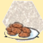
Bastantes galletas [Suficientes]