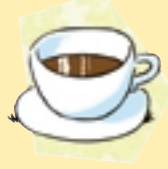
Bastante chocolate [Suficiente]