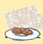
Pocas galletas [No suficientes]