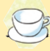
Nada de chocolate