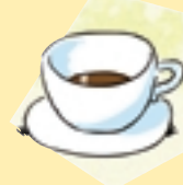
Poco chocolate [No suficiente]